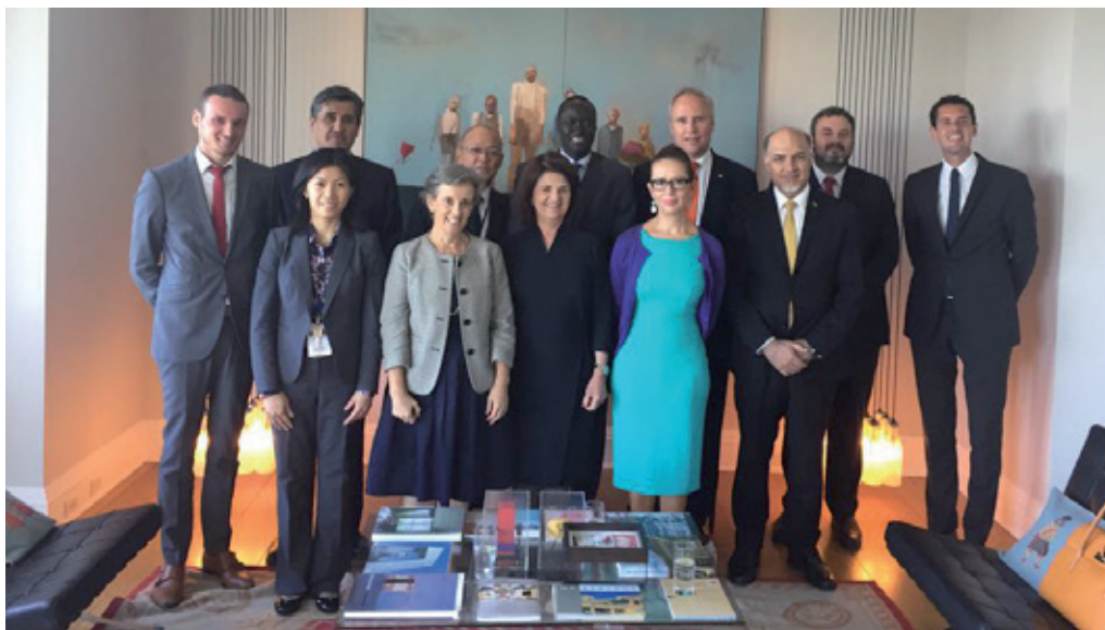
Aanbieding van het rapport ‘ Monitoring Target 16.2 of the United Nations Sustainable Development Goals ’ tijdens de jaarlijkse bijeenkomst van de Verenigde Naties.

In samenwerking met United Nations of Drugs and Crime (UNODC) bracht de Nationaal Rapporteur eind september 2017 een rapport uit waarin voor het eerst een betrouwbare schatting gemaakt werd van het daadwerkelijke aantal slachtoffers van mensenhandel in Nederland (zie §3.1.4). De Nationaal Rapporteur was uitgenodigd om over dit rapport en de schattingsmethode te vertellen tijdens één van de evenementen van de jaarlijkse bijeenkomst van de Verenigde Naties.