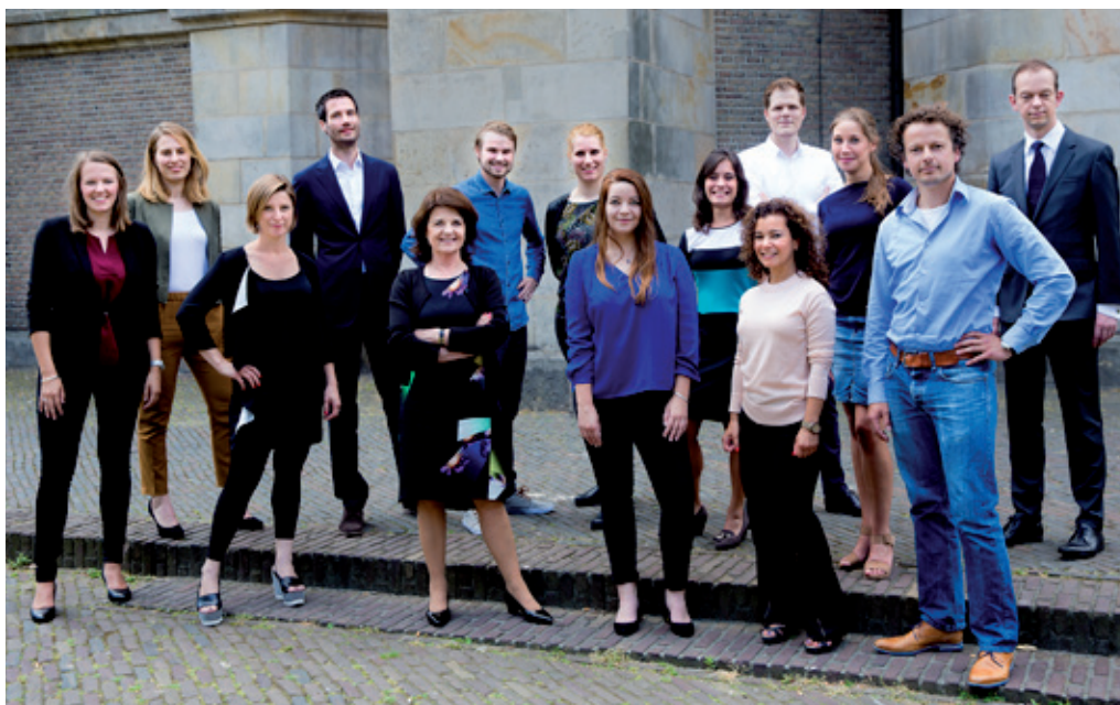
Het team van de Nationaal Rapporteur Mensenhandel en Seksueel Geweld tegen Kinderen in juli 2017.