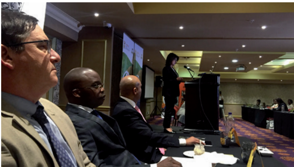
De Nationaal Rapporteur spreekt over seksueel geweld tegen vrouwen in Johannesburg.