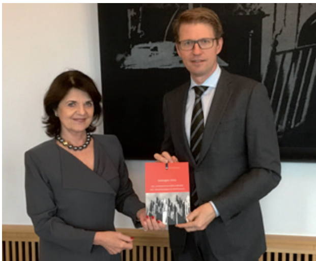
Aanbieding van beide delen van het rapport 'Gewogen Risico' aan de minister voor Rechtsbescherming Dekker

Over het recidiverisico van zedendelinquenten wordt niet adequaat gecommuniceerd in het strafproces, concludeerde de Nationaal Rapporteur in het eerste deel van haar rapport 'Gewogen Risico', dat in februari 2017 uitkwam. Uit het onderzoek onder gedragsdeskundigen, reclasseringswerkers, officieren van justitie en rechters bleek dat deze beroepsgroepen te weinig gedeelde kennis hebben over wat precies het risico is dat zij proberen te beperken. Hierdoor bestaat de kans dat zedendelinquenten onder- of overbehandeld worden. Naar aanleiding van dit onderzoek deed de Nationaal Rapporteur de aanbeveling dat kennis over risico in de relevante opleidingen aan bod moet komen, en dat de strafrechtsketen moet komen tot formats om te communiceren over risico.