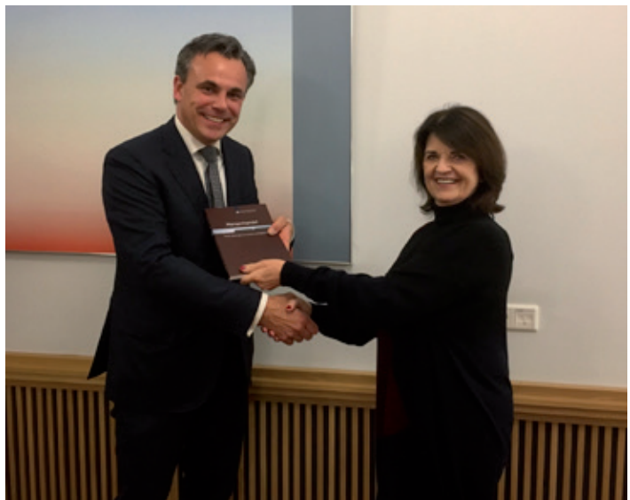
Aanbieding rapport 'Mensenhandel. Tiende rapportage van de Nationaal Rapporteur' aan staatssecretaris van Justitie en Veiligheid Harbers.

Op dit rapport is gereageerd middels de beantwoording van de Kamervragen van Kamerleden Kuik en Segers (CU) en die van Van der Staaij (SGP). De staatssecretaris van Justitie en Veiligheid geeft daarin aan dat het onwenselijk is dat momenteel verschillen bestaan tussen verschillende aanbieders van de bedenktijd en dat hij naar aanleiding van het rapport nadere afspraken zal maken met de organisaties om te komen tot een uniforme wijze van aanbieden van de bedenktijd. Tevens expliciteert hij dat de vraag of een zaak tot een succesvolle vervolging zal komen geen rol mag spelen bij de beslissing over de bedenktijd. Voorts heeft de staatssecretaris aangekondigd met een integraal plan van aanpak te komen dat ziet op mensenhandel. Hierin zal onder meer aandacht worden besteed aan de vraag hoe gemeenten verder gestimuleerd en gefaciliteerd kunnen worden om hun verantwoordelijkheid te nemen in de bestrijding van mensenhandel en de ondersteuning van slachtoffers. De minister van Volksgezondheid, Welzijn en Sport (VWS) stelt dat hij in de gesprekken die hij voert met de artsenfederatie KNMG de mogelijkheid tot het uitbreiden van de meldcode met het onderwerp mensenhandel zal benadrukken evenals hun belangrijke rol in de aanpak van mensenhandel. Tevens geeft hij aan met de KNMG in gesprek te gaan over kennisuitwisseling en training over het signaleren van mensenhandel.