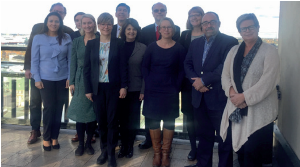
De Nationaal Rapporteur met de andere leden van de advisory board van HEUNI in Finland.

Op 20 oktober gaf de Nationaal Rapporteur een presentatie over het schatten van verborgen populaties met MSE en dataverzameling bij de Finnish anti-trafficking NRM-group. Aansluitend was de Nationaal Rapporteur te gast bij de HEUNI Advisory Board meeting. HEUNI is het European regional institute in het United Nations Criminal Justice and Crime Prevention Programme. De Nationaal Rapporteur maakt op verzoek van de Secretaris-Generaal van de VN deel uit van de advisory board van HEUNI.