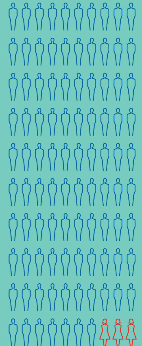
GEMIDDELD IS 97% VAN DE GEREgistREERDE JEUGDIGE VERDACHTEN VAN EEN ZEDENMISDRIJF EEN JONGEN.

Jongeren kunnen seksueel geweld alleen of met anderen plegen. Hoewel jongens meestal dader zijn van seksueel geweld, kunnen ook meiden seksueel geweld plegen.